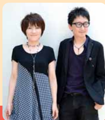
大ヒット「冬のファンタジー」などで人気

【主催】 杉並オレンジバルーンフェスタ協議会 【共催】 杉並区医師会・杉並区・東京都区西部緩和ケア推進事業運営会議 【後援】 杉並区歯科医師会・杉並区薬剤師会・杉並緩和ケア研究会・ 杉並区訪問看護ステーション連絡会・杉並区居宅介護支援事業者協議会